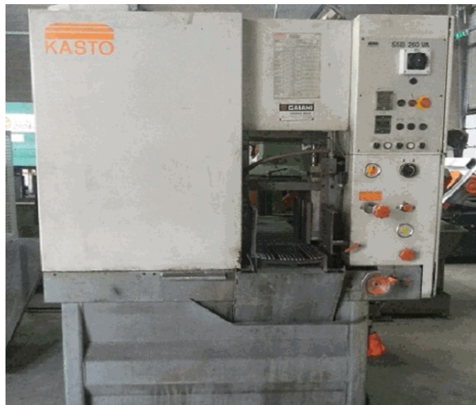
Fotografia non contrattuale